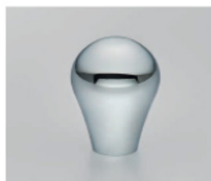
Laiton poli chromé