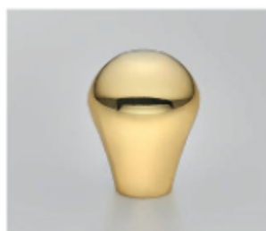
Laiton poli verni ou non verni

Nous pouvons avoir de nombreuses finitions : laiton brossé, laiton vieilli, laiton chromé, nickel satiné, nickel vieilli, noir mat etc.