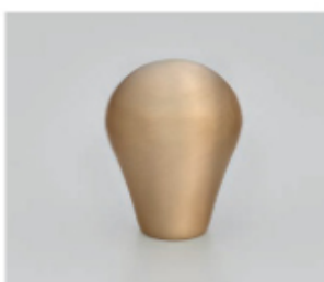
Laiton brossé/satiné verni ou non verni