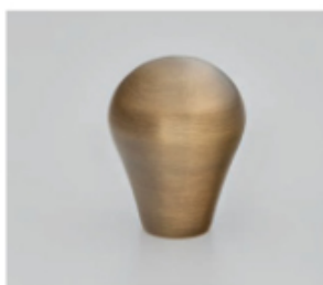
Laiton vieilli finition mate