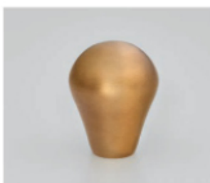
Laiton fumé ciré